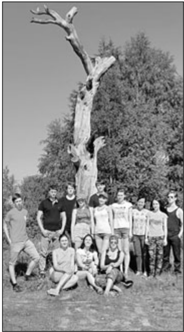
Участники лагеря у сосны Леннрота в поселке Калевала

Летний лагерь проходил в поселке Калевала, где ребята с первых дней ознакомились в историю родного края. Калевала — поселок с интересной историей, которая прослеживается на протяжении более четырех столетий.