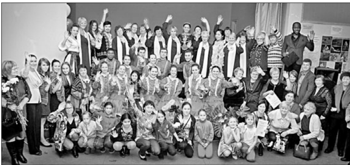
Участники проекта «Почему я дружу с соседом, или История многонационального Соломенного»

В 2017 году «Содружество» принимало активное участие в реализации мероприятий государственной инициативы «Многоязычная Карелия» по работе со средними школами №33 и №34 Петрозаводска. Школьники