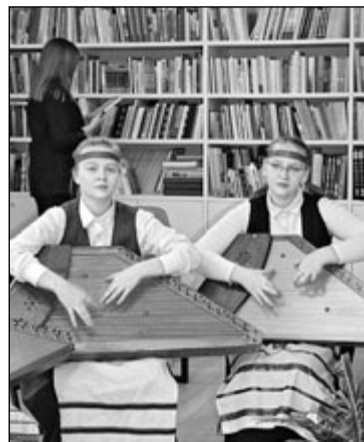
Выступают юные кантелистки