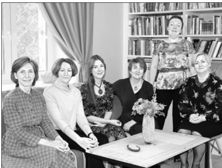
Сотрудники издательства «Периодика» в зале медиацентра

Поздравляем победителей конкурса и желаем им успешной реализации проектов!