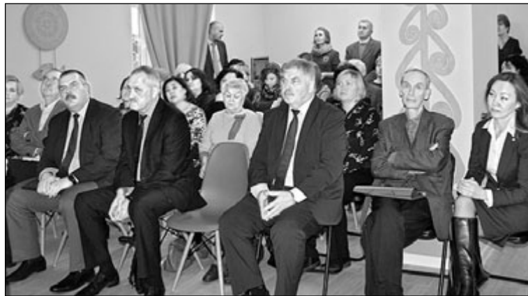
Участники церемонии открытия ресурсного языкового медиацентра

Все это говорит о том, что в республике достаточно оснований для создания Ресурсного языкового медиацентра карелов, вепсов и финнов Республики Карелия — как площадки для совместной работы журналистов национальных СМИ, национальных общественных организаций, представителей научного и образовательного сообще-