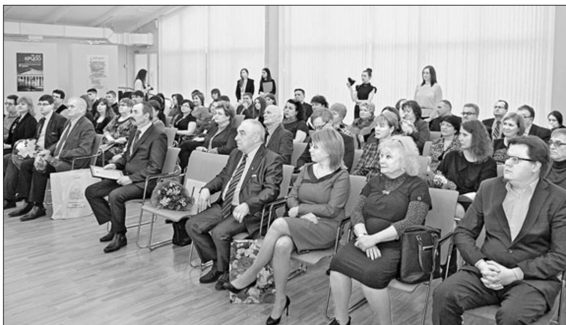
Участники торжественного собрания в зале Национальной библиотеки РК