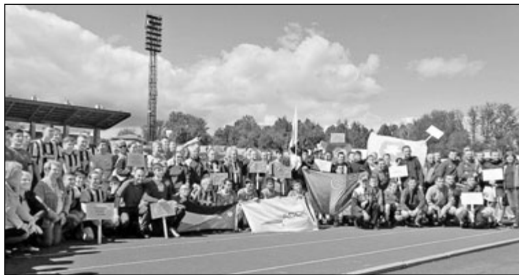
Футбольные команды — участники турнира «Кубок дружбы народов» на стадионе в Петрозаводске

«Кубок дружбы народов-2016» стал площадкой, объединяющей людей разных национальностей, а также положительным примером в решении вопросов укрепления международных отношений, уважительного отношения к культуре другого народа.