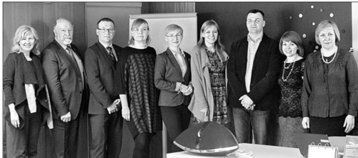
Партнеры проекта «Объединяя креативность»

К творческим индустриям относятся рекламу, архитектуру, художественный и антикварный рынок, ре-