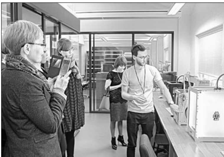
Медиафабрика. Университет Аалто