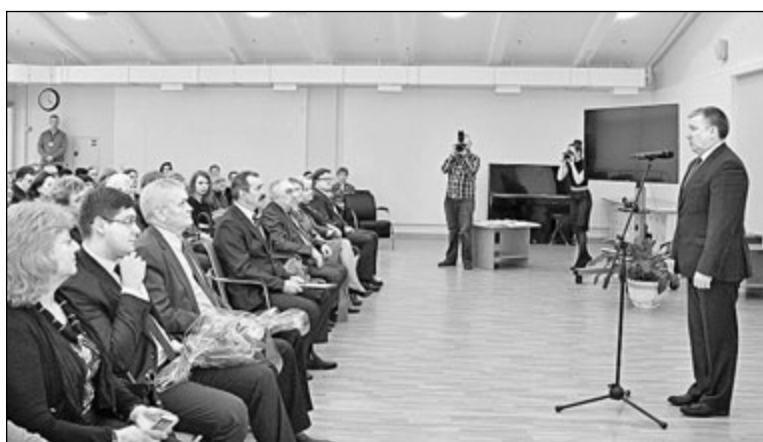
Выступление Главы Республики Карелия А. П. Худилайнена