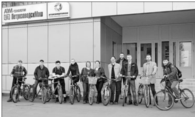
Участники акции у проходной «Петрозаводскмаш»

Для Петрозаводска это была уже 6 акция. И Петрозаводск занял 9 место (211 участников) по России. Напомним, что в зимней акции приняли участие 66 человек, а в рейтинговой таблице городов мы оказались в ТОП-100 городов!