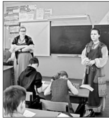
Гости из Петрозаводска выступают в Олонекской средней школе № 2

В администрации Олонекского национального района состоялось совместное заседание Консультативного совета по вопросам взаимодействия с национальными об-