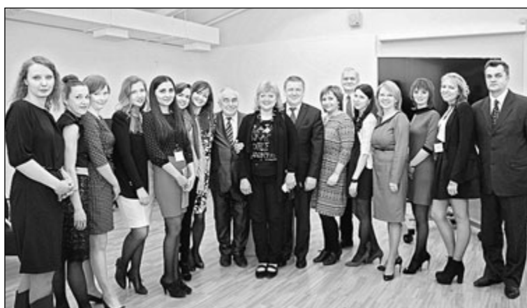
Почетные гости и сотрудники НП «КРЦОО»