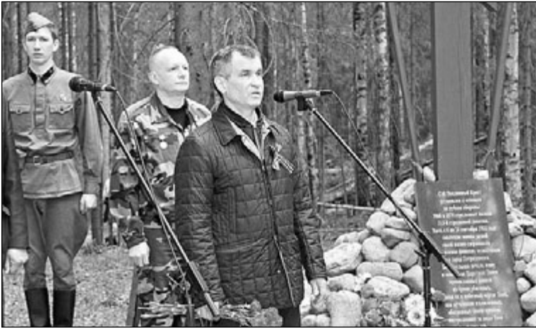
Рашид Нурғалиев выступает на торжественной церемонии открытия мемориала