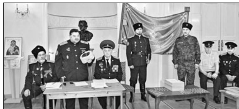
Празднование юбилея в Национальном музее Республики Карелия