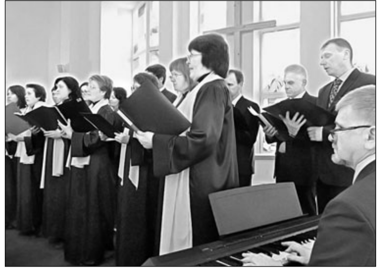
Звучит духовная музыка

Министерство выражает благодарность Православному приходу великомученика и целителя Пантелеимона г. Петрозаводска Петрозаводской и Карельской епархии Русской Православной Церкви (Московский Патриархат), Петрозаводскому приходу Римско-католической Церкви, Евангелическо-люте-